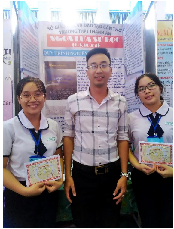
Hướng dẫn KHKT năm học 2018-2019 Hướng dẫn KHKT năm học 2020-2021