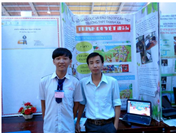
Hướng dẫn KHK năm học 2015-2016

Trong công tác giảng dạy, thầy luôn rất thân thiện, gần gũi với học sinh; không ngừng học tập, bồi dưỡng chuyên môn nghiệp vụ; luôn nghiên cứu và tìm tòi nhằm cải tiến phương pháp giảng dạy với mong muốn có những tiết dạy thật sinh động và mang lại hiệu quả học tập cho học sinh, ví dụ như: Sử dụng phần mềm vẽ sơ đồ tư duy để hệ thống hóa kiến thức (phần mềm iMindmap, phần mềm OKMindmap); sử dụng phần mềm tạo câu hỏi trắc nghiệm khách quan để ôn tập, kiểm tra đánh giá trên máy tính; sử dụng phần mềm Sanako để quản lý phòng máy hiệu quả; dạy học qua các trò chơi học tập được thiết kế bằng phần mềm Powerpoint, Violet,... Đặc biệt, thầy đã đóng góp nhiều giải pháp, sáng kiến hữu ích trong việc đổi mới công tác quản lý, ứng dụng công nghệ thông tin trong quản lý, dạy và học.