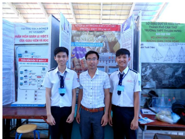
Hướng dẫn KHK năm học 2017-2018