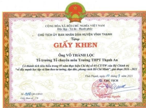
Giấy khen của UBND Huyện Vĩnh Thạnh tặng đảng viên đạt thành tích tiêu biểu thực hiện Chỉ 05-CT/TW

Thầy Lộc là người giáo viên gương mẫu đồng thời cũng là Đảng viên được đồng chí, đồng nghiệp tin yêu, luôn kiên định với đường lối đổi mới của Đảng, mục tiêu độc lập dân tộc và chủ nghĩa xã hội; trung thành với chủ nghĩa Mác - Lênin và tư tưởng Hồ Chí Minh. Có ý thức tổ chức kỷ luật, chấp hành nghiêm sự phân công, điều động của tổ chức, phấn đấu vì lợi ích chung. Luôn có ý thức chấp hành tốt và thường xuyên tuyên truyền, nhắc nhở, vận động mọi người trong gia đình, trong cơ quan, học sinh trong trường, nhân dân địa phương nơi cư trú thực hiện tốt các chủ trương, đường lối, nghị quyết của Đảng và chính sách, pháp luật của Nhà nước. Trong năm 2021, thầy được biểu dương, khen thưởng đảng viên tiêu biểu trong học tập và làm theo tư tưởng, đạo đức, phong cách Hồ Chí Minh giai đoạn 2016-2021 tại Hội nghị sơ kết Chỉ thị 05-CT/TW của huyện Vĩnh Thạnh.